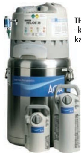
THEROX Lux -kotisäiliö ja kannettavia säiliöitä.