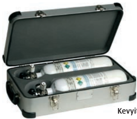
Kevyitä THEROX Light -happipulloja.

Kevyt THEROX™ Light happipullo sisältää kaasumaista lääkkeellistä happea. Se on erittäin hyvä vaihtoehto satunnaiseen liikkumiseen kodin ulkopuolella.