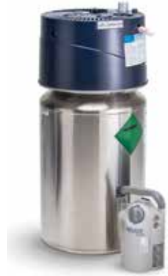
Nestemäistä happea sisältävä kotisäiliö ja kannettava säiliö