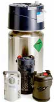
Nestemäisen hapen kotisäiliö ja kannettavia säiliöitä