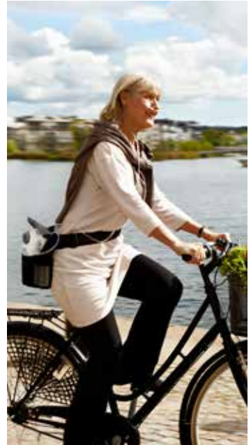
Kannettava säiliö nestemäiselle hapelle

Happihoitoon on tarjolla erilaisia lisävarusteita. Liikuteltavia laitteita varten on saatavana kärryjä, reppuja ja kantohihnoja, jotka helpottavat liikkumista. Lisäksi saatat tarvita erilaisia liittimiä tai suodattimia kiinteään happirikastimeen. Keskustele tarvitsemistasi lisävarusteista kuntoutusohjaajan kanssa.